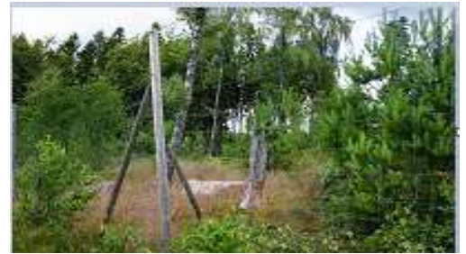
SKOG 160/23/15 Light Vridknut

Nät producerat av Trigalv® Low alternativt High Carbon tråd. De vertikala trådarna är avklippta och virade runt de horisontella trådarna och bildar s k Vridknut .