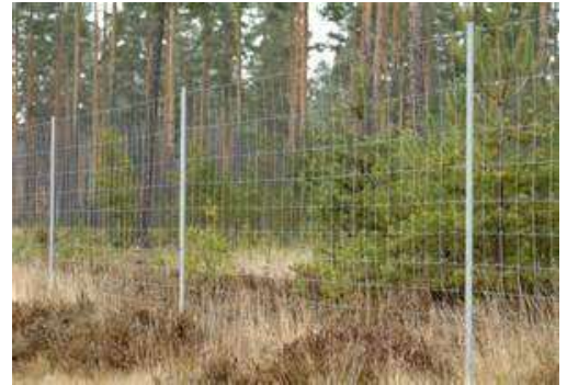
VÄG 210/12/15 Ringlock/Ögglåsning

Nät producerat av Trivalv® Low alternativt High Carbon tråd med ringlock knut som är fäst kring knutpunkten för de vertikala samt horisontella trådarna för att förhindra att de kan dras isär. De vertikala trådarna går okapade från topp till botten och ökar därmed stabiliteten på nätet