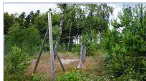
SKOG 200/17/15 Light Vridknut

Nät producerat av Trigalv® Low alternativt High Carbon tråd. De vertikala trådarna är avklippta och virade runt de horisontella trådarna och bildar s k Vridknut .