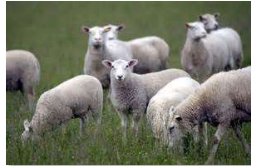
FÅR 120/8/30 Ringlock/Öggleåsning